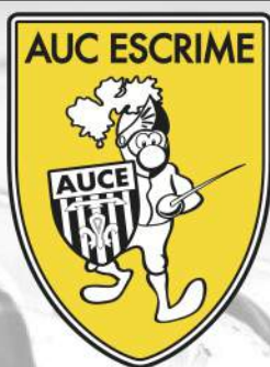
Tableau final à partir de 15h

organisé par l'AUC Escrime Samedi 23 & dimanche 24 mars 2019