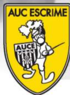
Tableau final à partir de 15h

Complexe du Val de l'Arc - Aix-en-Provence